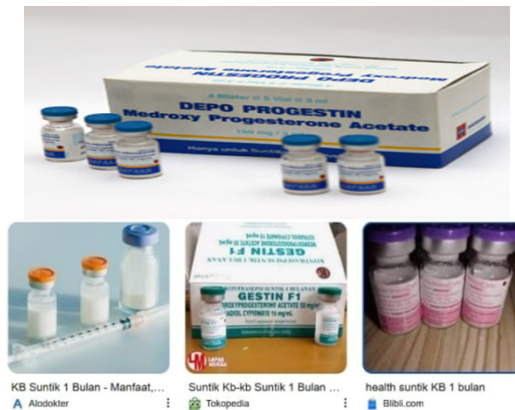
Gambar 3.3: Kontrasepsi Suntik 3 bulan

Ada dua varian dari suntikan kontrasepsi, yaitu yang bertahan selama tiga bulan dan yang hanya bertahan selama satu bulan. Metode ini lebih efektif daripada mengonsumsi pil KB, tetapi memiliki potensi efek samping yang lebih besar dibandingkan dengan jenis kontrasepsi lainnya.