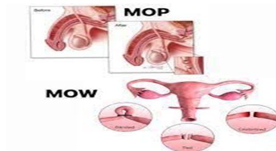
Gambar 5.1: Kontrasepsi Terkini

Keluarga Berencana adalah prosedur medis untuk menghentikan aliran sperma pria dengan jalan melakukan okolasi (penutupan) vasdeferens atau saluran sperma sehingga alur transportasi sperma terputus dengan tidak adanya sperma yang di keluarkan, maka proses fertilisasi (penyatuan sperma dengan ovum) tidak dapat terjadi.