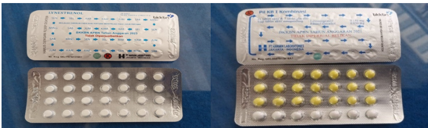
Gambar 3.1: Pil Kontrasepsi

Terdapat dua jenis pil KB, yakni pil kombinasi yang mengandung kedua hormon tersebut, dan pil yang hanya mengandung progesterone.