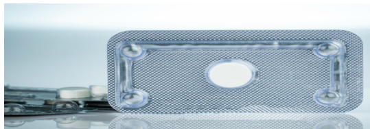
Gambar 3.2: Pil KB Darurat

Kontrasepsi darurat, atau yang lebih dikenal dengan sebutan “morning-after pill” adalah kontrasepsi yang digunakan untuk mencegah kehamilan setelah berhubungan seksual tanpa pelindung atau tanpa pemakaian kontrasepsi yang konsisten sebelumnya. Kontrasepsi darurat bekerja dengan cara mencegah atau menunda pelepasan sel telur dari ovarium atau mencegah terjadinya ovulasi dalam waktu 5 hingga 7 hari. Akibatnya, sperma-sperma yang berada di saluran reproduksi wanita akan mati karena sperma hanya dapat bertahan sekitar 5 hari. Hal inilah yang mendasari bahwa kontrasepsi darurat harus digunakan dalam waktu maksimal 5 hari setelah hubungan seksual.