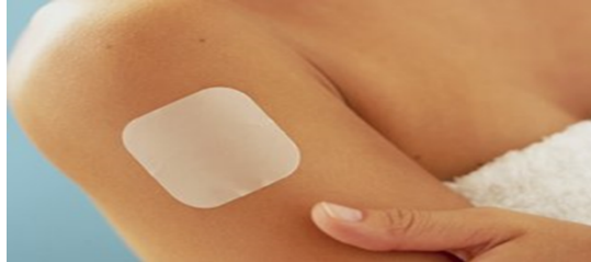
Gambar 3.5: Kontrasepsi Koyo

Kontrasepsi hormonal dengan sediaan koyo dapat digunakan di areal gluteus, deltoid, abdomen dan di thorax. Waktu penggunaan patch dapat dimulai 3 minggu pasca persalinan atau segera sampai 7 hari pasca keguguran, dan harus diganti setiap 3 minggu sekali. Kontrasepsi ini memiliki lapisan perekat yang sangat kuat, sehingga dapat digunakan mandi, berenang. Tetapi kekuatan perekat berbeda pada setiap individu, tergantung dari cara pemasangannya. Pada pasien dengan obesitas, angka kegagalan lebih tinggi dibanding pada Wanita dengan BB normal.