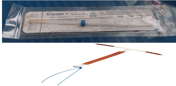
Gambar 3.7: IUD

IUD (Intrauterine device) memiliki bentuk seperti huruf T. Alat ini digunakan untuk ditempatkan di rahim guna mencegah sperma mencapai sel telur. IUD umumnya terbagi menjadi dua jenis utama: yang terbuat dari tembaga, seperti ParaGard, yang dapat bertahan hingga 10 tahun dan yang mengandung hormon, seperti Mirena, yang perlu diperbarui setiap lima tahun, berbentuk huruf T dengan kandungan levonorgestrel disebut juga levonorgestrel-containing intrauterine systems (LNG-IUS). Di Indonesia hanya tersedia satu jenis kontrasepsi ini, yaitu Mirena.