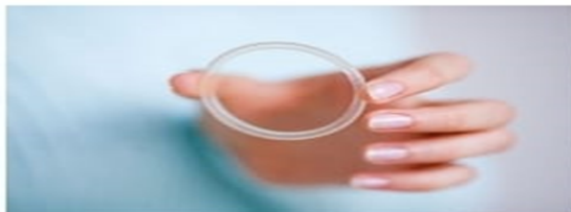
Cincin kontrasepsi vagina (cincin pengendali kelahiran) dimasukkan sendiri dan harus dilepas setelah 3

Cincin Vagina merupakan sebuah alat kontrasepsi berbentuk seperti cincin berwarna bening dan lembut serta fleksibel. Jenis kontrasepsi ini berdiameter 54 mm. Cara pemakaiannya dengan cara dimasukkan ke dalam vagina. Cincin vagina kemudian akan melepaskan estrogen dan progestin secara perlahan. Hormon dilepaskan oleh cincin vagina berfungsi untuk mencegah ovulasi dan menebalkan mukosa atau lendir servis dan menipiskan dinding Rahim sehingga mempersulit terjadinya implantasi hasil pembuahan.